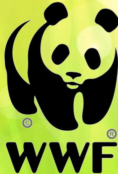
Емблема Всесвітнього фонду природи

Всесвітній фонд природи - міжнародна неурядова організація, що опікується збереженням природи, дослідженнями та відновленням природного середовища. Це найбільша незалежна природоохоронна організація у світі, що має близько 5 млн працівників і добровольців по всьому світу, працюючи в понад 120 країнах. Щорічно здійснює понад 1200 екологічних проєктів, привертаючи увагу людей до проблем охорони навколишнього середовища і їх розв'язання