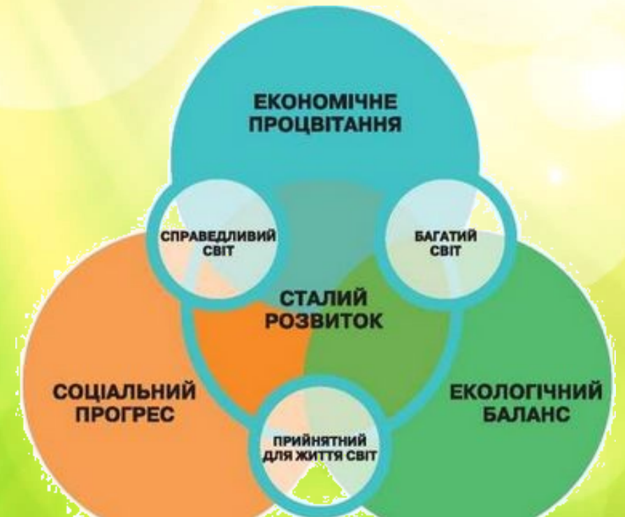
Триєдина концепція сталого розвитку