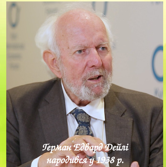
Герман Едвард Дейлі народився у 1938 р.