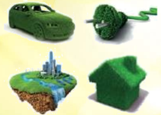
Символи пріоритетних напрямів «зеленої» економіки в Україні