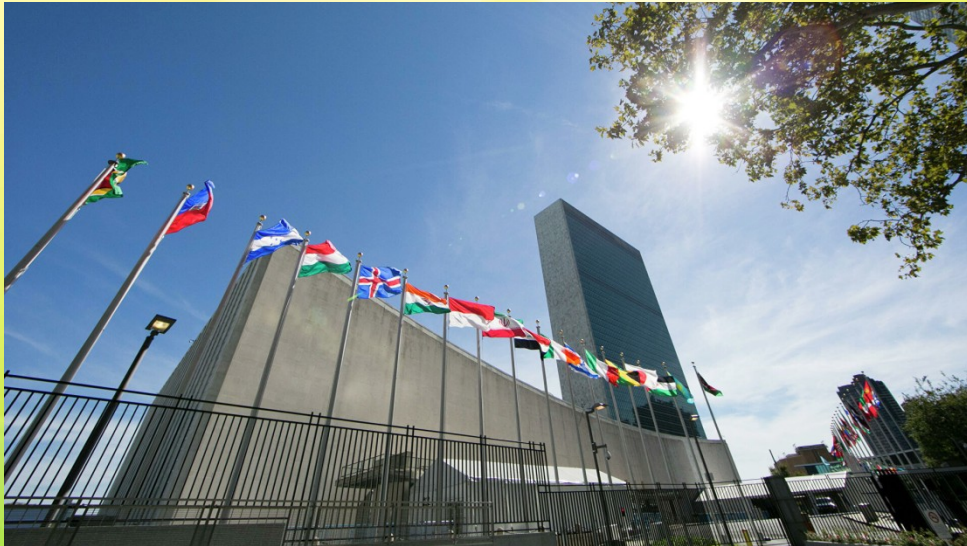
Організація Об'єднаних Націй Штаб-квартира в Нью-Йорку, США. ООН є центром зосередження природоохоронного співробітництва держав